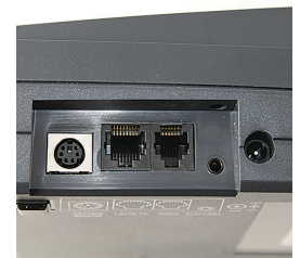
Bezpośrednie podłączenie wagi, czytnika kodów kreskowych, komputera i szuflady na pieniądze