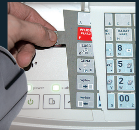
Wymienna wkładka klawiatury