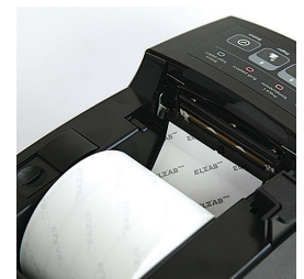
Mechanizm drukujący easy load