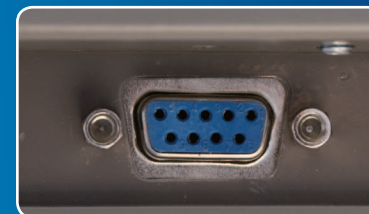
Port RS 232 do komunikacji z komputerem i drukarką

Sprzedawane urządzenia mogą nieznacznie różnić się od prezentowanych na zdjęciach.